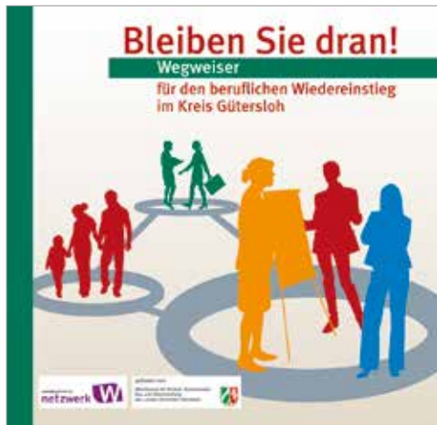
Broschüre mit ausführlichem Adressteil

Der berufliche Wiedereinstieg nach einer familienbedingten Erwerbsunterbrechung bedeutet nicht immer den Weg zurück in den einmal erlernten Beruf. Auch die Notwendigkeit oder der Wunsch nach einer beruflichen Veränderung kann der Grund für eine berufliche Neuorientierung sein.